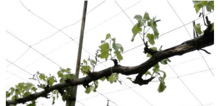
↑ シャインマスカット短梢栽培展葉5～6枚目