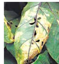
ナス 連作障害(半身萎凋病)