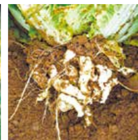
ハクサイ 連作障害(根こぶ病)