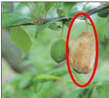
心くろみ病 被害果実