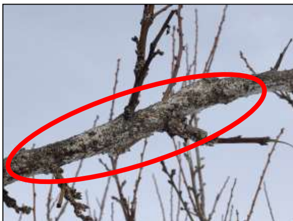
ウメシロカイガラムシ越冬成虫